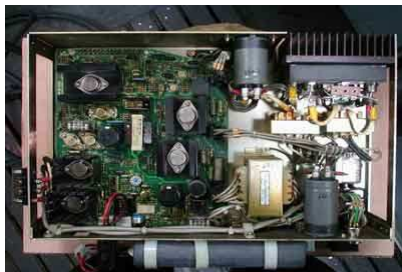
Netzteil mit Speicherbatterie