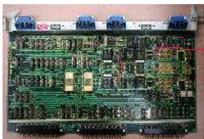
Mess- und Regelplatine für Vorschubantrieb X- und Z-Achse